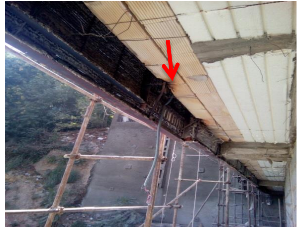
شکستن کاور تیرچه و گرفتن اتصال برای نبشی سنگ نما