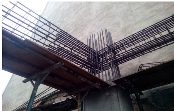
شکل ۶. وضعیت نامناسب اتصال تیر به ستون