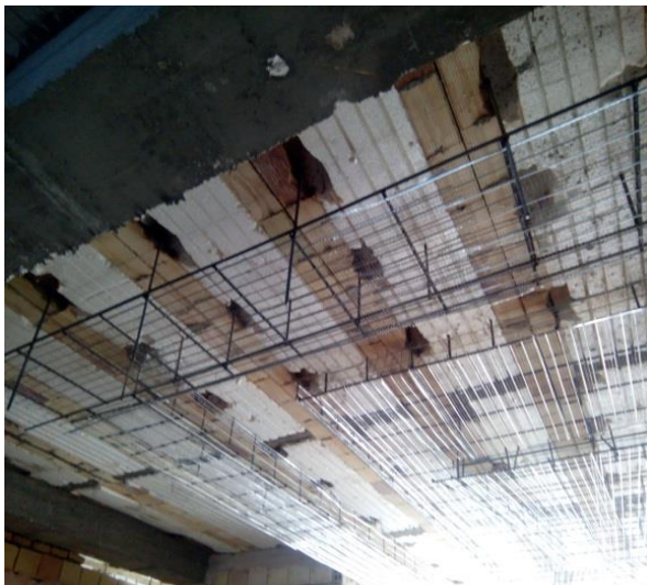
شکستن کاور تیرچه و گرفتن آویز برای سقف کاذب