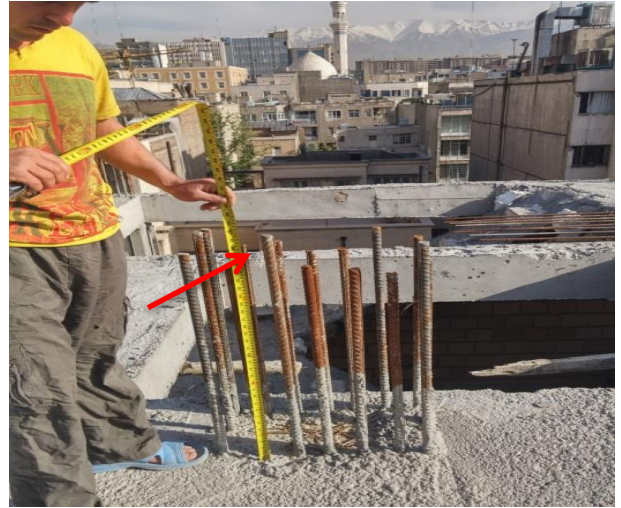
شکل ۲. کوتاه بودن طول وصله پوششی میلگردهای ستون