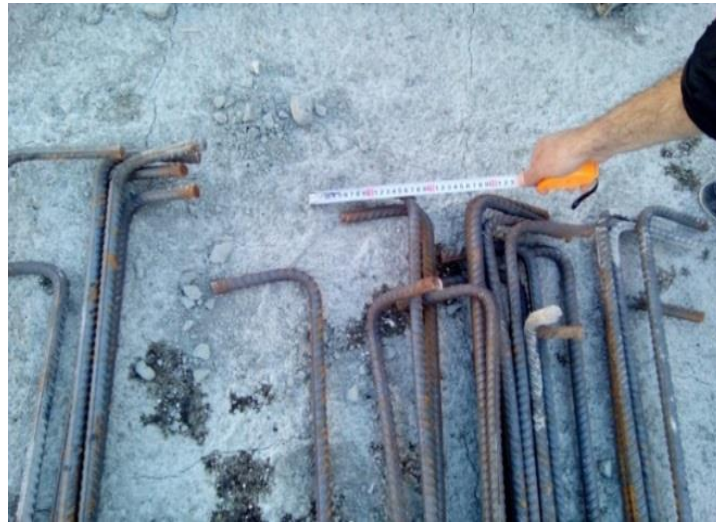
شکل ۴. طول خم انتهایی آرماتور کمتر از 12db (دوازده برابر قطر آرماتور) کمتر است.