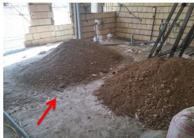
شکل ۲۰. استفاده غیر مجاز از خاک مخلوط در کفسازی طبقات و بام