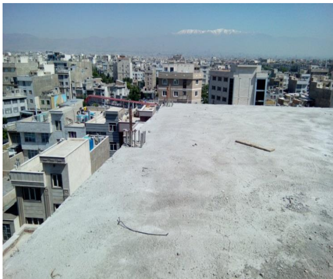
شکل ۱. عدم مهار مناسب آرماتور طولی ستون در سقف آخر (این عکس نشان میدهد که خم ۹۰ درجه آرماتور طولی انتهای ستون اجرا نشده و یا آرماتور طولی ستون فاقد طول مهاری لازم در داخل بتن است.)