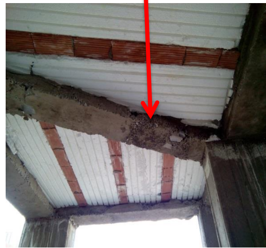
شکل ۱۱. اجرای نامناسب بتن ریزی و قالب بندی سقف

عدم نظافت و کاور نامناسب آرماتور و کرموشدگی