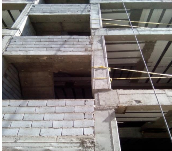
شکل ۹. قالب بندی نامناسب در محل اتصال تیر به ستون و اجرای نامناسب تغییر مقطع ستون بتنی