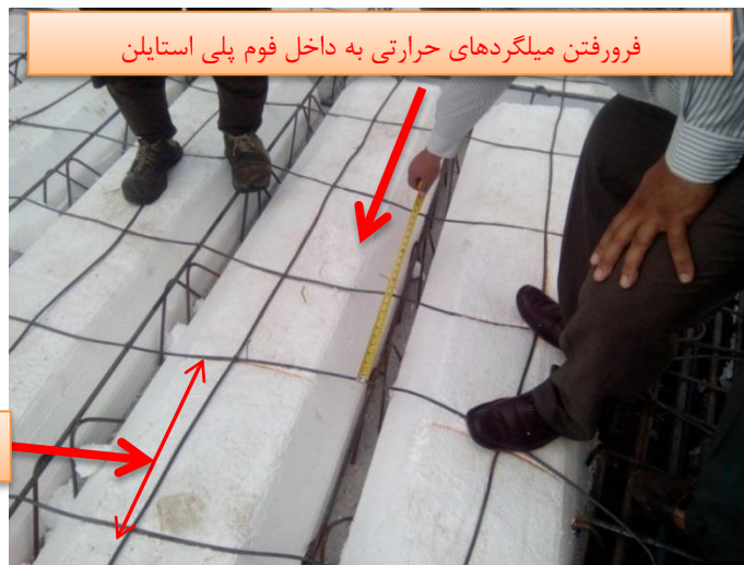
شکل ۱۸. عدم رعایت مشخصات آرماتور حرارتی

➤ در سقف های تیرچه بلوک ، تامین آرماتور افت و حرارت در دال رویه در هر دو جهت موازی و عمود بر تیرچه ها ضروری است . چنانچه میلگرد فوقانی در دال رویه قرار گیرد می توان آن را بخشی از فولاد حرارتی موازی با تیرچه لحاظ نمود. در هر صورت در موازات تیرچه تامین حداقل یک آرماتور بر روی بلوک ها ضرورت دارد. همچنین در حین بتن ریزی سقف لازم است که آرماتورهای حرارتی به بالا کشیده شود و از روی سطح بلوک ها فاصله گیرند.