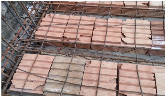
شکل ۱۵. جلوگیری از ورود بتن به داخل بلوکهای مجوف در بتن ریزی سقف

➤ سوراخ های بلوک های مجوف در محل ژوئن و کناره ها بمنظور جلوگیری از ورود بتن به داخل بلوک، مسدود شود.