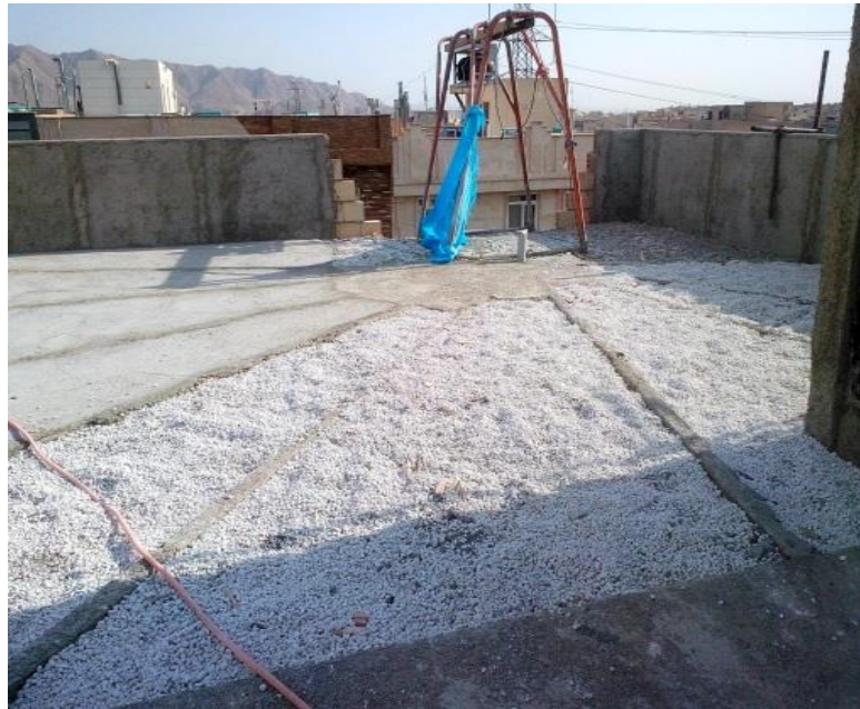
شکل ۲۱. استفاده از مصالح سبک در کفسازی بام.