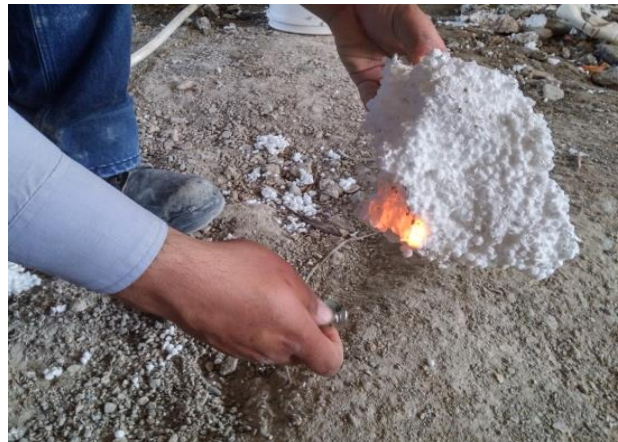
شکل ۱۴. تست کندسوز بودن بلوک های سقفی پلی استایرن

➤ از بلوک پلی استایرن مطابق با استاندارد ملی ایران به شماره ۱۱۱۰۸ با چگالی مناسب و مواد کندسوز استفاده شود. در هر صورت لازم است آزمایش شعله وری بلوک ها در کارگاه انجام شود و خاموش شدن شعله بعد از دور شدن منبع آتش، رویت شود. تحقیقات نشان داده استفاده از مواد دیرسوزکننده (Flame retardant) در فرآیند تولید پلی استایرن می تواند بلوک پلی استایرن را به ماده ای کندسوز و خود خاموش شونده تبدیل کند.