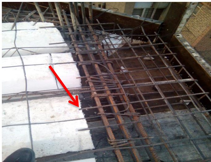
شکل ۱۷. عدم مهار مناسب آرماتور منفی دال در سقف

➤ اجرای مناسب ژوئن در سقف تیرچه و بلوک از لحاظ ابعاد ، راستا و همچنین آرماتور گذاری آن کنترل شود. ➤ در صورت وجود کنسول دال بتنی لازم است میلگردهای فوقانی اصلی دال ( میلگردهای منفی) در داخل سقف به نحو مطمئن مهار گردد.