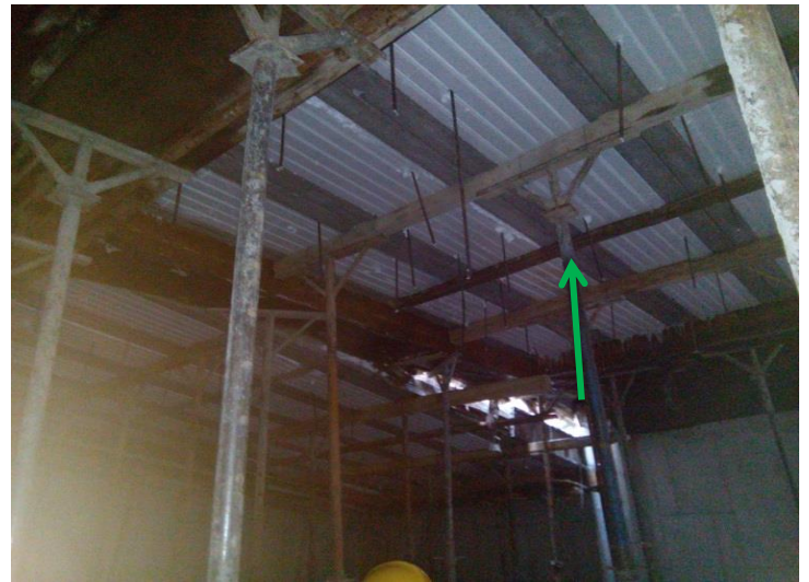
اجرای صحیح آویز برای سقف کاذب قبل از بتن ریزی سقف