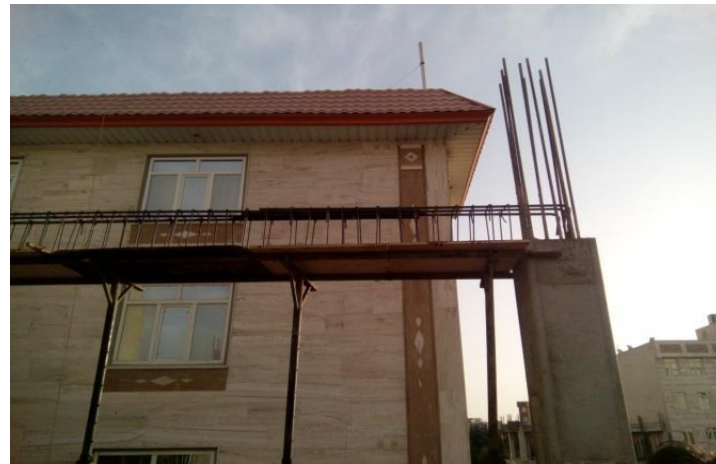
شکل ۵. وضعیت نامناسب اتصال تیر به ستون (عدم اجرای خاموتهای محل اتصال تیر به ستون)