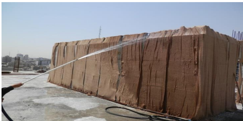
شکل ۱۰. عمل آوری بتن در هوای گرم (بهتر است جهت جلوگیری از فرار رطوبت بتن روی گونی چتایی نابلون یا هر نوع عایق رطوبتی مناسب کشیده شود).