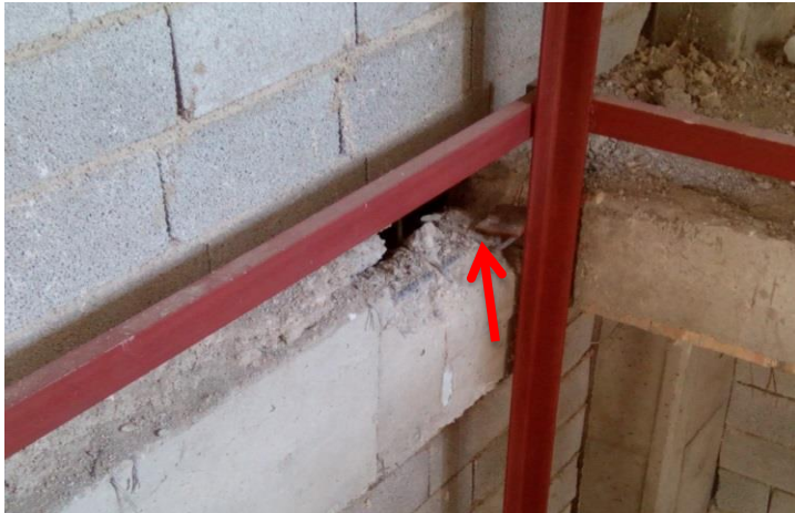
شکستن کاور تیر و گرفتن اتصال برای نبشی آسانسور