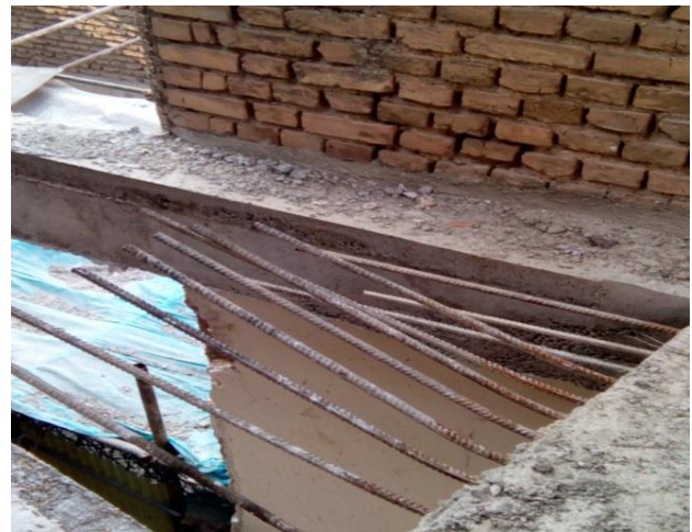
شکل ۸. اجرای آرماتوربندی دال راه پله به صورت شبکه تک لایه