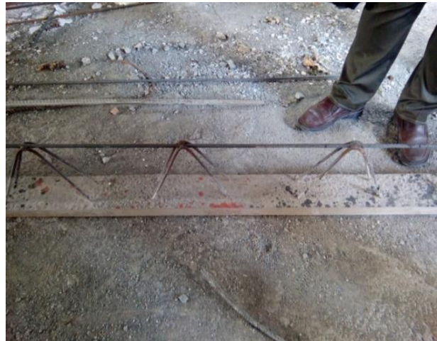
شکل ۱۳. فاصله زیاد آرماتور برشی در شکل سمت راست و خیز نامتعارف تیرچه فوندوله ای در تصویر سمت چپ