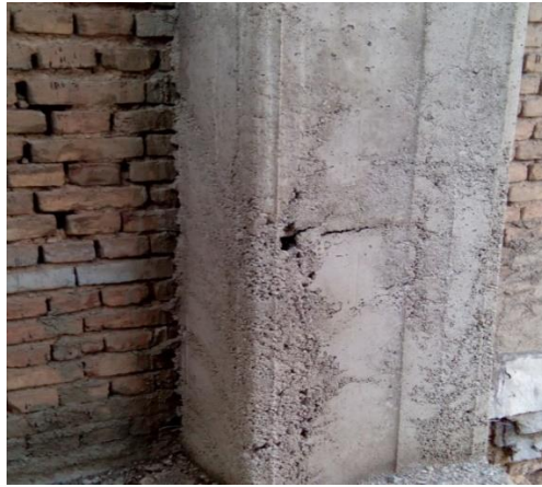
شکل ۱۲. عدم تراکم کافی بتن و دانه بندی نامناسب