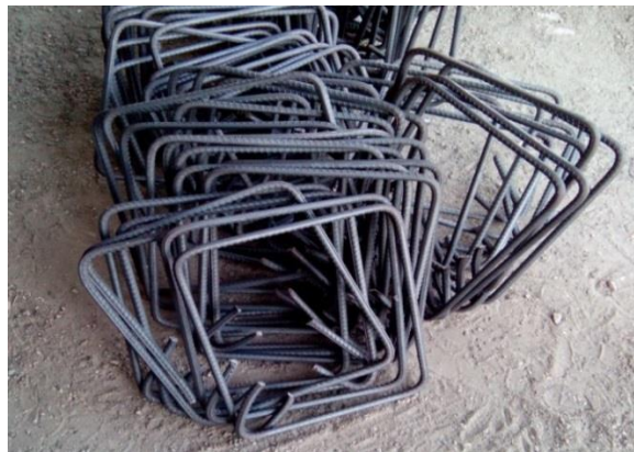
شکل ۳ - رعایت زاویه ۱۳۵ درجه خم انتهای خاموت (برای سازه های با قاب خمشی ویژه)