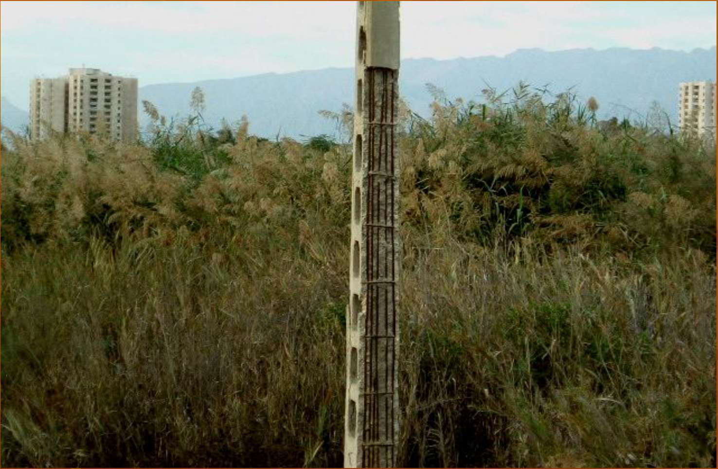
Abandoned Electric Pole