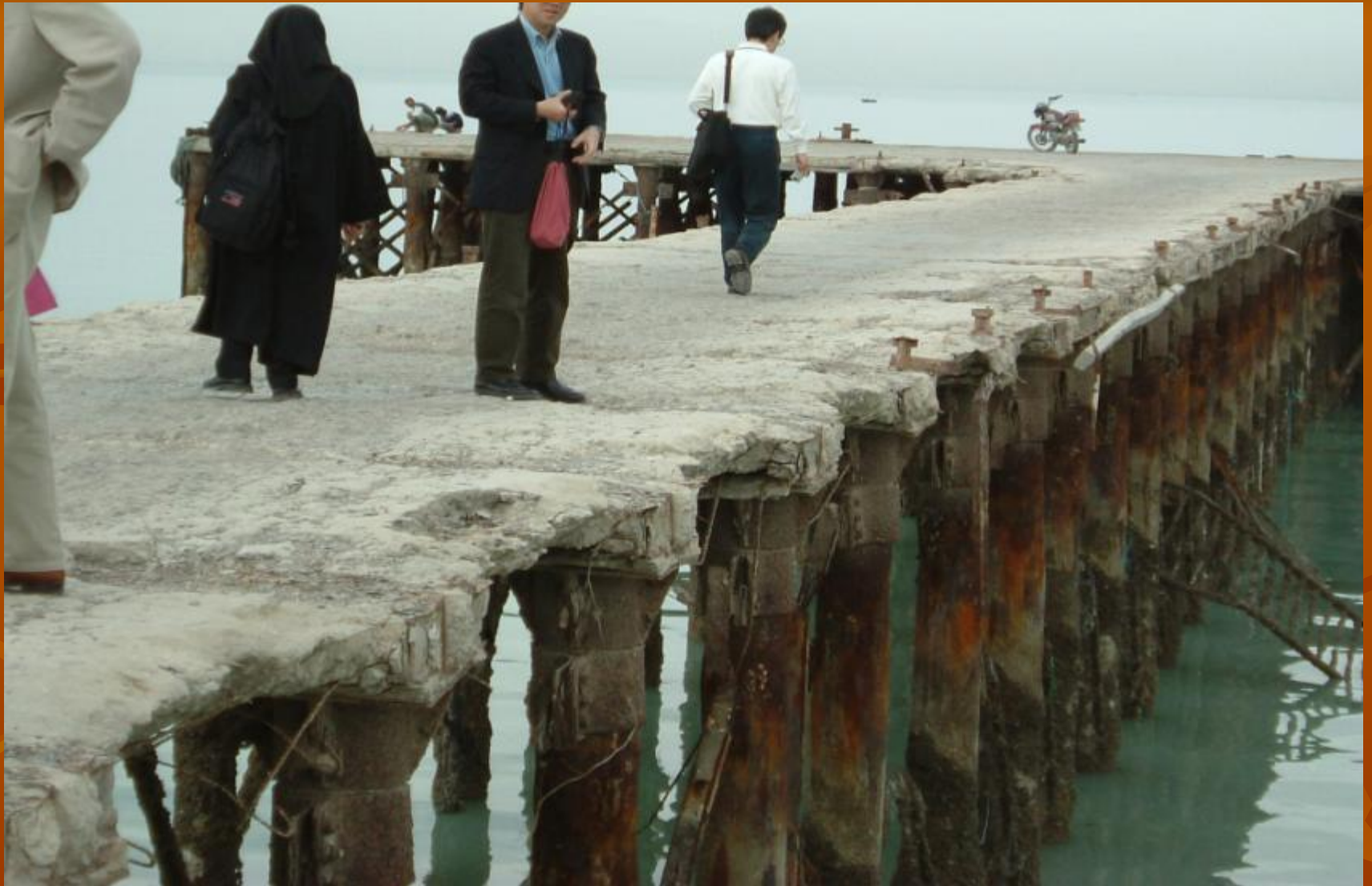
Jetty in QESHM Island