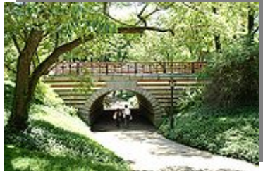
پارک وی طراحی شده توسط المستد در سنترال پارک

شاید به نظر برسد پارک وی ها همان اتوبانهای اروپا هستند اما پارک وی جاده ای است برای تفریح خاطر انسان که به زیبایی و لطف مطابق پست و بلند طبیعی زمین ادامه می یابد و جزئی از مناظر طبیعی می شود چندان که تمییز آن از مناظر طبیعی ممکن نیست. (کتاب فضا، زمان، معماری)