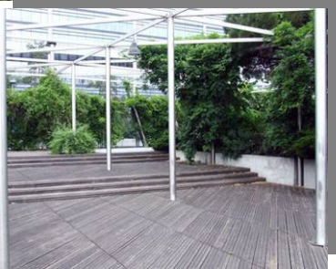
فضای چند منظوره

استفاده از سازه معماری در فضا سازی کفسازی پارک