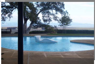
استخر آب و مجسمه در وسط آن