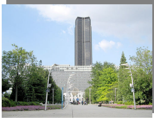
نمایی از برج مون پرناس

نکته*: تنها برج تاریخی پاریس با 37 طبقه مون پرناس است و تمامی برج های بالای 7 طبقه در حومه قرار دارد. برج مون پرناس چند طبقه در زیر زمین دارد و سقف مجموعه به صورت پارک در آمده است.