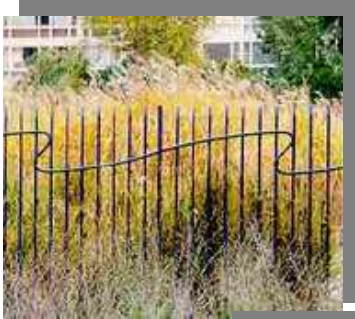
دیتیل نرده (دلیل قید مواجی)