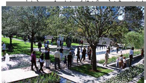
باغ مجسمه nasher

رنزو پیانو ، معمار مجموعه برای طراحی باغ مجسمه ، واکر را برگزید. این پروژه به عنوان یک گالری روباز طراحی شده که گنجایش 20-30 مجسمه را دارد. هندسه کامل و سادگی پر عمق آن ، زمینه مناسبی برای بازدید و تمرکز روی مجسمه ها فراهم آورده است. در عین اینکه خود باغ هم یک اثر هنری برای تجربه کردن است که مخاطب را به سمت مجسمه ها می کشد.