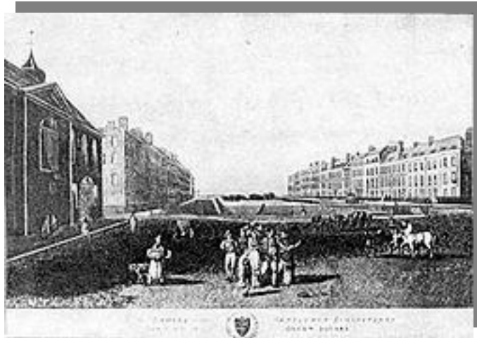
سبزه میدان بلومزبری

در اواخر این قرن انقلاب صنعتی رخ داد و زندگی مردم را دستخوش تغییرات زیادی کرد از آن جمله می توان به گسترش شهرنشینی اشاره نمود به تبع آن شهرهای اروپایی یکپارچه دستخوش تغییر و تحولات شدید و نوعی بی نظمی و آشفتگی می شوند که متفاوت با ساختار قبلشان است. با هجوم مردم به شهرها تراکم بالا می رود و مشکلات زیادی را از بیماری تا رفت و آمد و... ایجاد میکند. این مسئله جامعه را به سمت توجه به طبیعت در کنار زندگی شهری سوق می دهد و مفهوم پارکهای شهری شکل میگیرد.