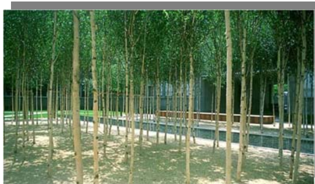
تکرار ریتم درختان در فضا سازی