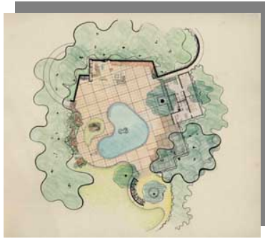
پلان پارک دانل

عناصر مهم در طراحی این پارک عبارت است از: